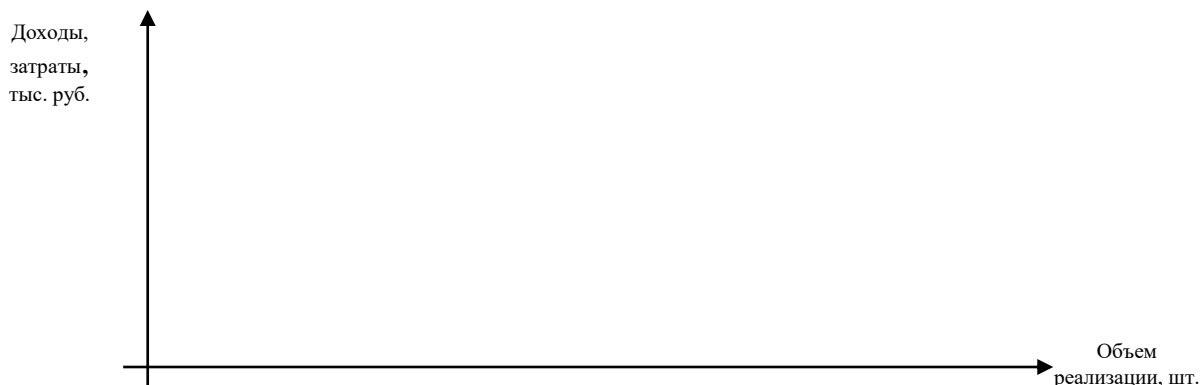
Рис. 2. Графическое определение точки окупаемости затрат на изделие

Анализ полученных расчетных и плановых показателей позволяет сделать следующие выводы: . . .